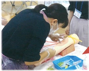
模擬腕を使用した採血