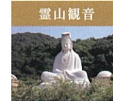
靈山観音 ひときわ目を引く大きな観音様。願いをかなえてくれる「願い玉」(パワースポット)や良縁をかなえてくれる仏様「愛染明王堂」があり見所いっぱいです。