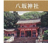
八坂神社 「紙面さん」の名で親しまれる1300年以上の歴史を持つ神社。境内の大国主神社は縁結びの神様が祀られ、美御前社は身心が美しくなるといわれ、女性に大人気です。