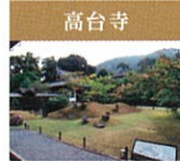
高台寺 豊田秀吉の正室北政所が夫の菩提を弔うために開創した寺院。数々の重要文化財があり、そのひとつ豊屋は北政所の墓所となっています。