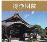
得浄明院 信州善光寺大本願の京都別院の尼寺。關山上人は伏見宮野家親王の第3王女・誓願尼公。大ささの遠いにあるものの、本堂は信州善光寺と同じ造りになっています。