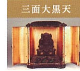
三面大黒天 秀吉出世守り本尊の三面大黒天であり、大黒天・皇沙門天・井財天の3つを合体、パワースポットとしても有名。