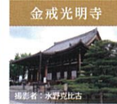
金戒光明寺 法然上人が比叡山の修業を終え、最初に念仏を唱えられた場所であり、奥谷さんと呼ばれ親しまれています。新選組葬送の寺でもあり、多くの重要文化財やめずめずしい五劫思惟仏像(アフロ)も。