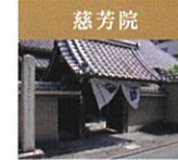
慈芳院 鎌倉前期に作られた左手に小さな薬師をもつ京都を代表する薬師如来石仏があり、ホッとする空気を漂わせています。通常非公開。