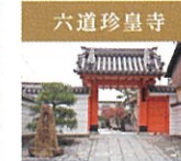
六道珍皇寺 「六道さん」の名で親しまれ、お盆の精霊迎えに参詣する寺として知られています。あこの世とこの世の境の社が境内にあると言われ、普段井公の冥界への入口とされる井戸などもご覧いただけます。