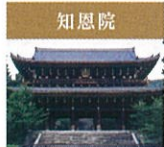
知恩院 平安末期より法然上人が住まわれ念仏の教えを説かれた場所。徳川三代(家康・秀忠・家光)によって現在の寺域が形づくられました。国宝の三門は任尊です。