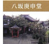
八坂庚申堂 日本三庚申の一つであり、ご本尊の青面金剛は飛鳥時代に中国大陸より渡来。開基浄観法師は紙面祭の「山伏山」の主役。境内には「庚申」のお慰いのくぐり橋がいたるところに吊り下がっています。