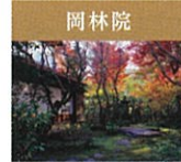
岡林院 1608年久林玄昌禅師によって創建。現在残っている高台寺塔頭の中心では最も古い。創建当初は北政所の念じ仏と同じ千体地蔵がご本尊であった。庭は墓地として作られた苔の庭であり、茶席「忘知席」は豊千家又尾庵の写しとして有名。