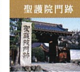
聖護院門跡 寛治4年(1090年)、増誓大僧正が白河上皇より賜ったのが聖護院の始まりです。皇室との関係が深い門跡寺院。本山派修験(山伏)の総本山でもあります。