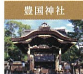
豊国神社 豊田秀吉公を祀る。神社正面の唐門は伏見城遺構と伝わる国宝建造物。宝物館には重文「豊国祭礼図屏風」など多数の宝物を所蔵しています。今回、宝物館内でもご覧いただけます。