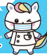
「看護の日」キャラクター かんごちゃん